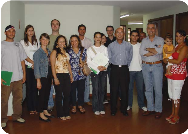
Entrega de cédula em Curitiba no dia 1º de fevereiro.

No dia 21 de novembro, os novos profissionais de Curitiba estiveram na sede do CRMV-PR para a solenidade de entrega das cédulas, que foi comandada pelo presidente do CRMV-PR, Masaru Sugai. Dia 21 de dezembro, houve entrega de cédulas em Londrina e Curitiba para prestigiar os novos médicos veterinários e zootecnistas do Paraná.