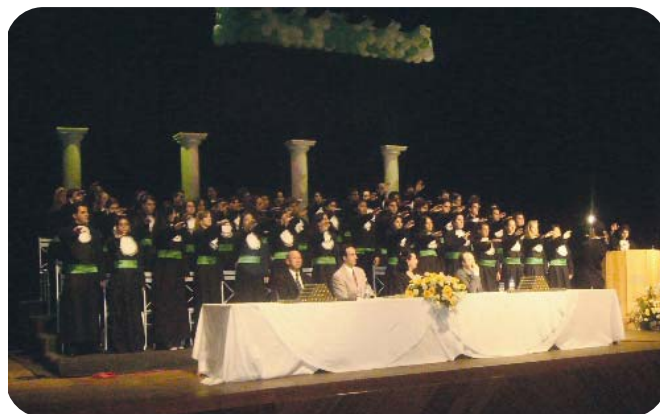
Formatura de Medicina Veterinária da UEL.