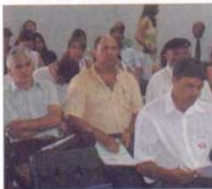
Seminário em Ivaiporã

O Manual de RT é de extrema importância para que os profissionais pos-