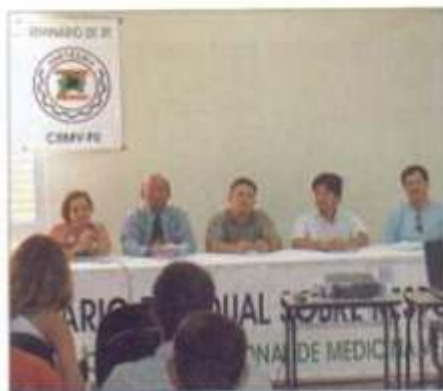
Seminário em Campo Mourão