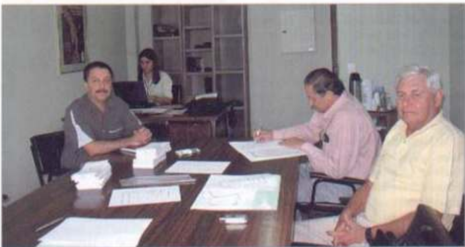
Comissão Eleitoral Regional

O profissional que estiver em dúvida com relação à sua situação financeira (junto a Autarquia) deve entrar em contato com o CRMV-PR